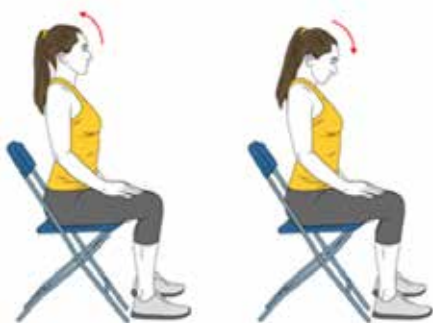
1 BAIXAR I PUJAR LA MIRADA