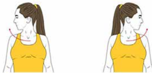
2 GIRAR EL CAP A LA DRETA I A L'ESQUERRA