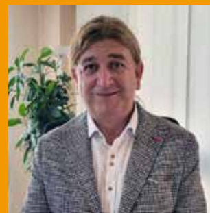
David Masot Florensa Alcalde de Maials